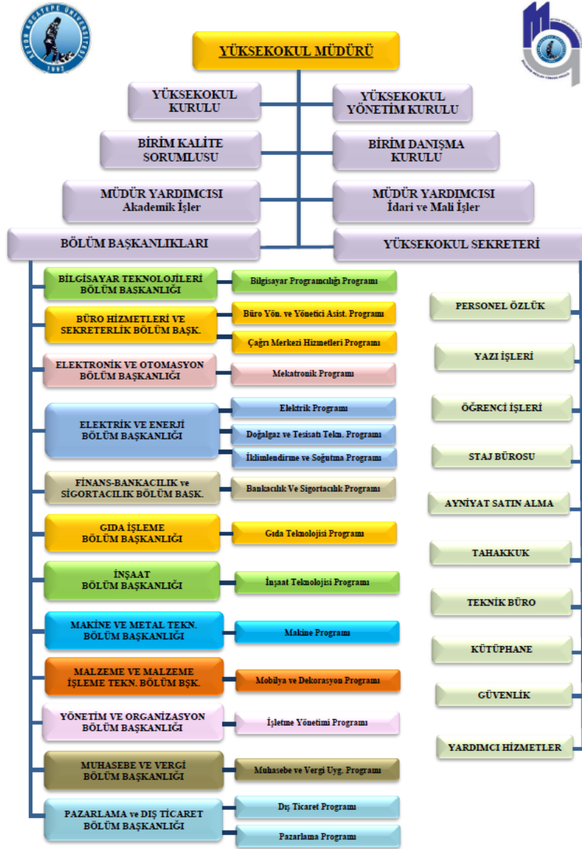
Tablo 9.1. Bolvadin Meslek Yüksekokulu Organizasyon Şeması